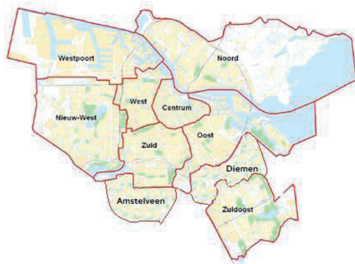
Figuur 2 wijkplattegrond van Amsterdam