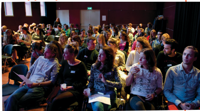
Studieverenigingenoverleg UvA in de Muziekzaal

ASVA ondersteunt de studieverenigingen van de HvA en de UvA en creëert een netwerk van verenigingsbesturen. Eens in de zes weken organiseer je samen met de coördinator studieverenigingen een studieverenigingenoverleg, waar je verenigingsbesturen verbindt en trainingen geeft.