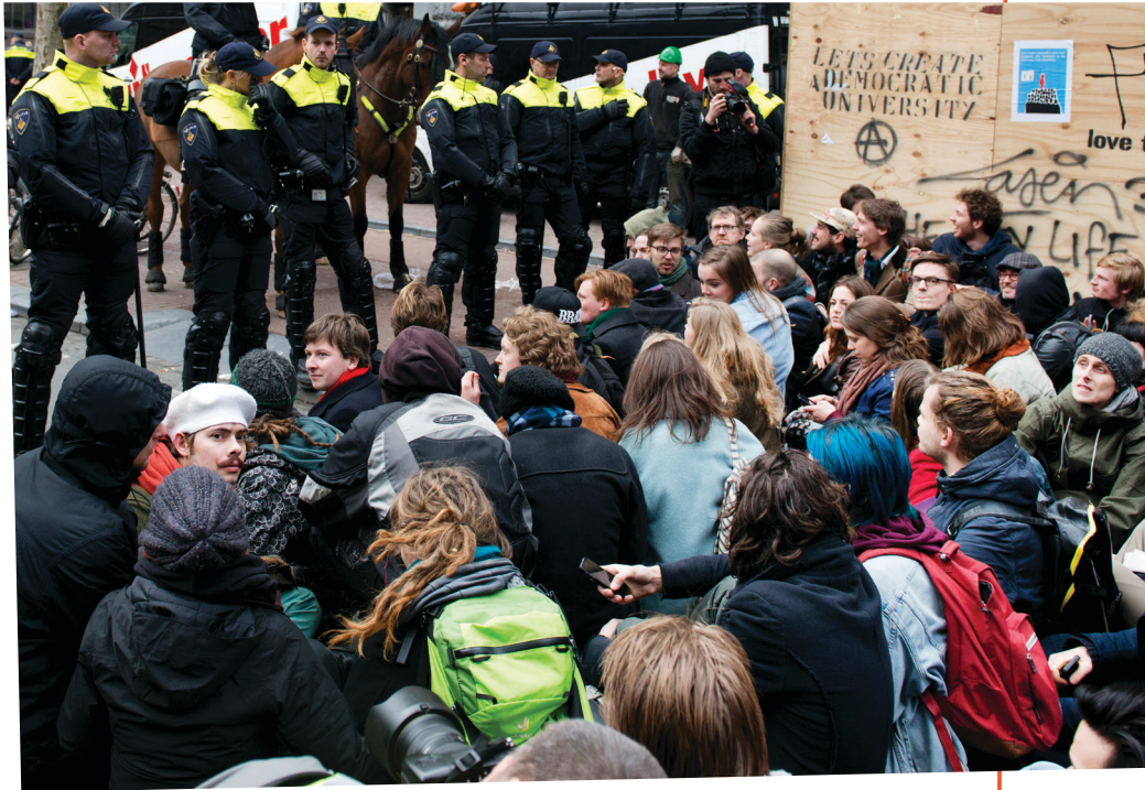
De ontruiming van het Bungehuis (2015)