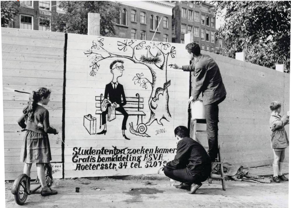
ASVA zet zich in voor studentenhuisvesting (1956)