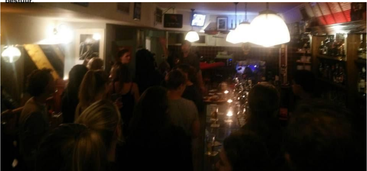
Figuur SEQ Figuur 1* ARABIC 3. Een vol café P96 tijdens de jaarlijkse Alumniborrel ft. Nieuwe bestuur.

Behaald: Op de BBQ en alumniborrel ft. Nieuw bestuur en in de whatsappgroep is deze vraag gesteld. Laagdrempelige activiteiten op handige momenten (doordeweeks niet te vroeg) is het belangrijkste advies. Reden om niet lid te worden is onvoldoende binding met andere oud ASVAten of het hebben van teveel andere sociale verplichtingen.