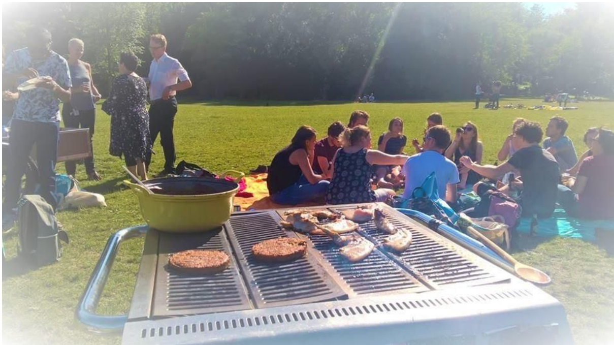
Figuur 6. De succesvolle zomerBBQ door ASVA en de Alumnivereniging.