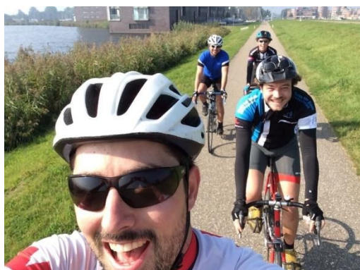
Figuur SEQ Figuur \* ARABIC 5. Sfeerimpressie van de Alumnirides. Voor herhaling vatbaar!

Met de alumnivereniging hebben we enkele nieuwe activiteiten aan ons repertoire toegevoegd. Zo ontstond op een alumniborrel het idee voor de eerste (en in het najaar zelfs tweede) Alumniride, een fietstocht voor alumni. Ervaring is niet noodzakelijk, enkel een helm en een fiets. Met een gemêleerd gezelschap dat onze verwachtingen overtrof werd de eerste editie koers gezet naar de enige heuvel die de polderrijke omgeving van Amsterdam rijk is: het Kopje van Bloemendaal. Ondanks dat de alumniride geen race was, werden na afloop op het terras van CREA toch even de Stravatijden van 'de Muur van Kennemerland' vergeleken. Doordat deze tocht door alle deelnemers als een groot succes werd ervaren, vond in de nazomer zelfs een tweede editie plaats. Ditmaal kwam de droom van Markus in vervulling en werd zijn befaamde route 'OverBruggen' door Flevoland verreden, verrijkt met een prachtige route voor de terugtocht door mastodont Weeda.