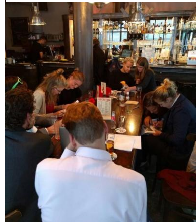
Figuur 1. Inwerkpubquiz voor het inwerkende bestuur 16|17